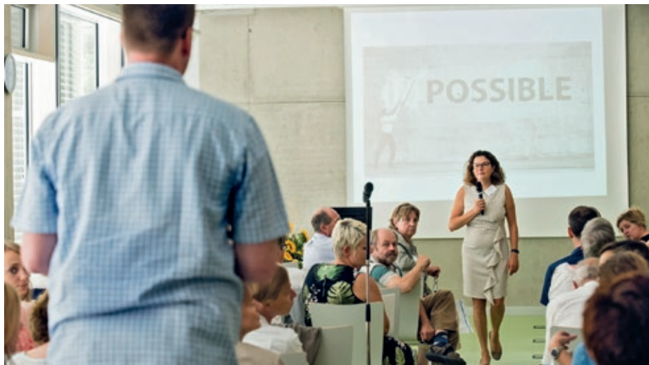
Lebhafte Diskussion beim Arbeitstreffen „Masterplan Medizinstudium 2020“

Hier findet ein in Deutschland bislang einmaliges interprofessionelles Lehrprojekt statt. Studierende der Medizin am Nürnberger Standort der Paracelsus Medizinischen Privat-