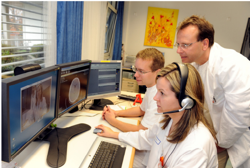
Die telemedizinische Anlage auf der Stroke Unit Nürnberg

Die praktische Umsetzung der Telekonsile im Netzwerk erfolgt durch modernste Computer- und Kommunikationstechnologie: mMit Videoübertragungen in Echtzeit (S-DSL-Verbindung) und paralleler Übertragung von CT- oder MRT-Bildern des Gehirns im DICOM-Format kann der Experte im Zentrum den Patienten per ferngesteuerter Videokamera und mit Unterstützung des Arztes vor Ort genau untersuchen und beurteilen. Der Patient vor Ort hört und sieht den Arzt im Zentrum auf einem Monitor und kann über ein Ruummikrofon zu ihm sprechen.