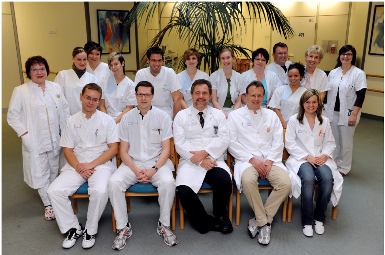
Das Team der Stroke Unit Nürnberg

Die Behandlung erfolgt in enger Zusammenarbeit mit den Kliniken für Neuroradiologie, Kardiologie, Neurochirurgie, Gefäßchirurgie und Physikalische Medizin.