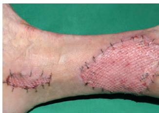
Ulcus (vorher / nachher)