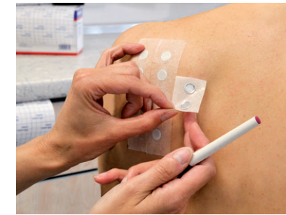
Testung Nahrungsmittel-Allergie (links)